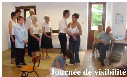
Journée de visibilité