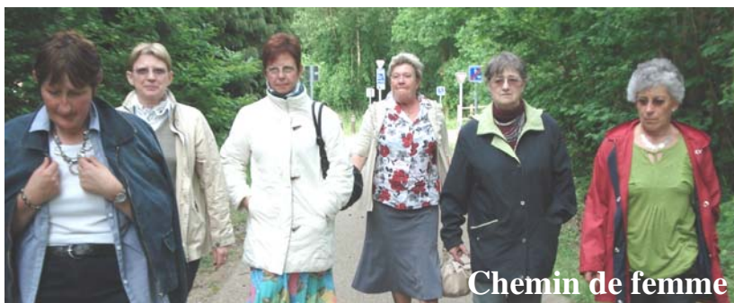
Chemin de femme