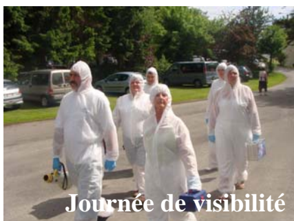
Journée de visibilité