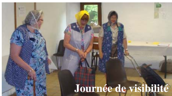
Journée de visibilité